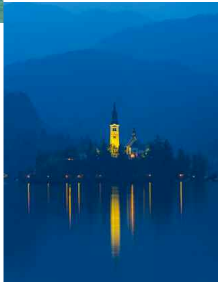
(Izq.) Sugerente imagen del lago Bled con la iglesia iluminada. (Dcha. Arr. y Ab.) Lago Bohinj y rótulos situados en el teleférico de Vogel.

norte (y que es el más antiguo del país) acaba de añadir encanto al idílico lago. Todo eso, además de su clima de montaña, contribuyó, sin duda, a convertir a la ciudad y su entorno en uno de los primeros lugares de veraneo alpino en Europa. Si llegáis hasta aquí tenéis que probar el famoso pastel de crema de la ciudad, el kremna rezina . Con él y con estas magníficas vistas acabamos nuestra placentera ruta por las montañas eslovenas. ♦