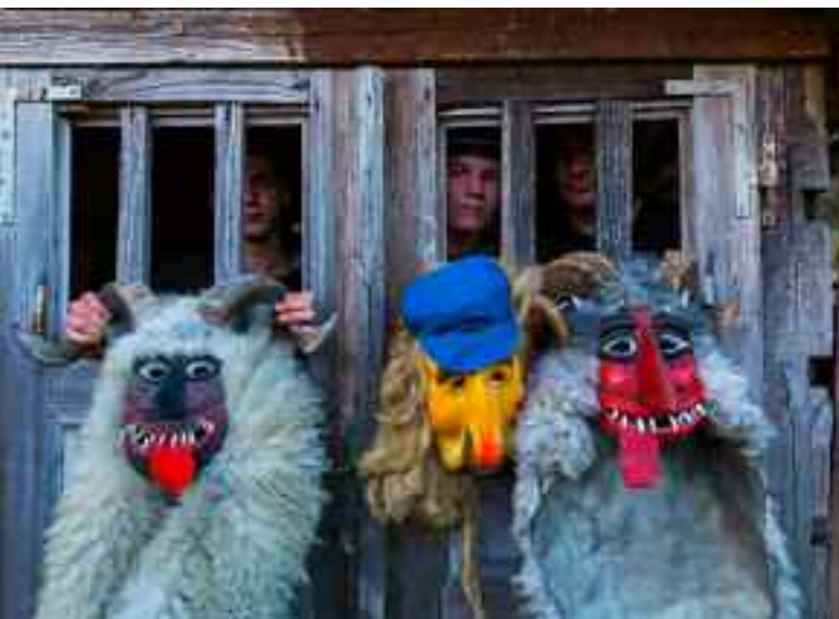
(Arr. Izq.) Con estos colores tan intensos lucen las fachadas de Kobarid. (Ab. Izq.) Curiosas máscaras del carnaval de Dreznika, en el municipio de Kobarid. (Dcha.) El río Soca se presta a la práctica de deportes acuáticos.

aprovechando el encajonamiento de las aguas en una garganta donde los rápidos hacen las delicias de los más intrépidos. También cuenta con una cara menos ociosa que le hizo pasar a la Historia, pues fue el escenario de una de las más cruentas batallas de la Primera Guerra Mundial. El clima invernal y la escasa preparación que los soldados tenían para transitar por la nieve aumentaron la tragedia. Tiempo antes, estas montañas y este río vieron pasar otros ejércitos. De ello da cuenta el puente que lleva por nombre punto de Napoleón , construido para facilitar el paso de las tropas napoleónicas en 1750. Su destrucción y defensa durante la contienda de las dos guerras mundiales se conmemora hoy con sendos monumentos en sus extremos. En las proximidades, un arroyo tributario del Soca crea las llamativas cascadas de Kozjak . Varias pozas de un verde intenso se enlazan mediante seis caídas de belleza cautivadora.