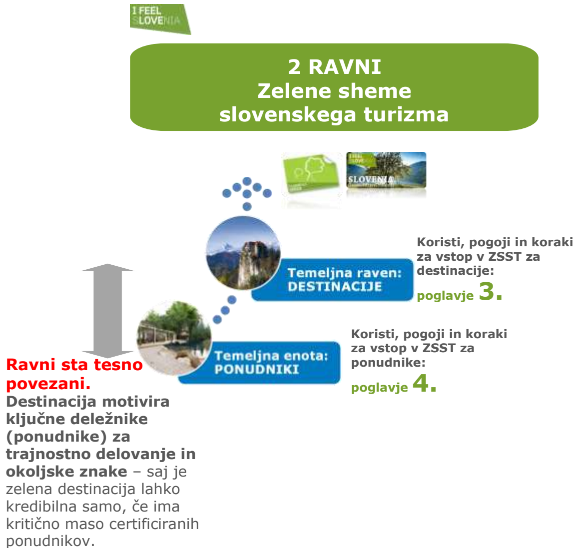
Shema št. 1: Prikaz dveh ravni delovanja ZSST