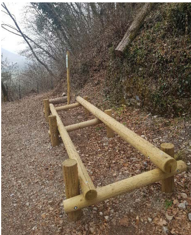
lesena naprava za razgibavanje

Preko projekta Merlin je Občina Tolmin v letu 2020 na Kozlov rob uredila dve sprehajalni poti, južno Gozdno pot in severno Grajsko pot. Pred kratkim je na obstoječi trim stezi, ki je speljana ob vznožju hriba, implementirala nove fitnes naprave in lesene elemente za rekreacijo s predstavitvijo vaj. Ker je Kozlov rob umeščen tik poleg urbanega okolja, je to tako za domačine kot za obiskovalce hitro dostopno območje, ki jih motivira in vzpodbuja k zdravemu načinu življenja.