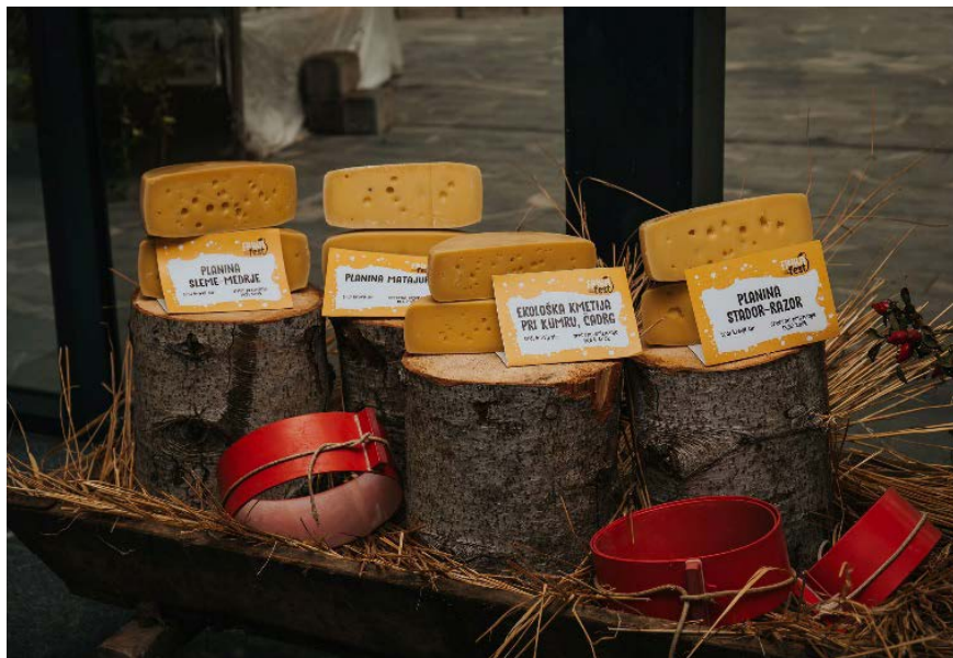
Lokalni izdelki na Frikafestu

Za promocijo in ponudbo lokalnih izdelkov skrbimo na raznih sejmih in dogodkih (Kobariški sejem, Jestival, Frikafest, Festival soške postrvi) ter v vseh TIC-ih (Bovec, Kobarid, Tolmin).