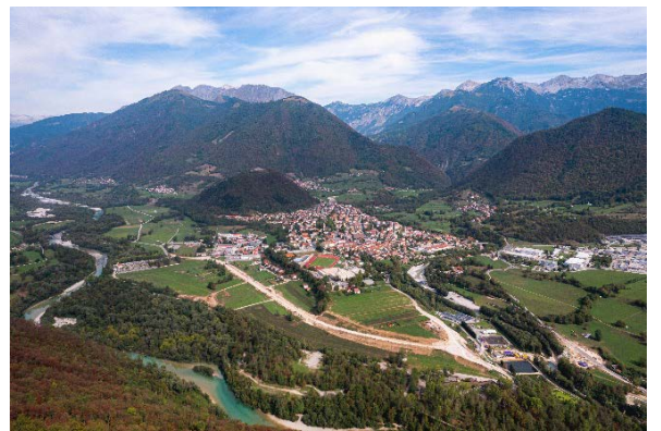
Razgledna točka na poti Po Bučenic