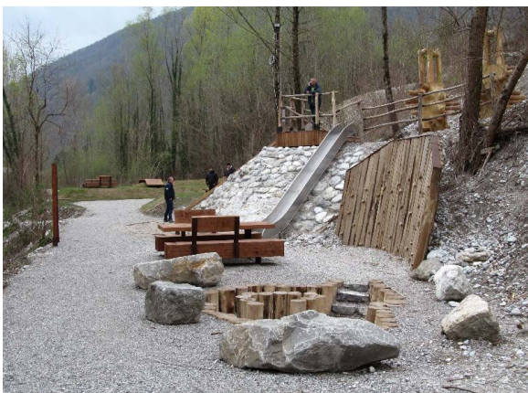
Učna pešpot ob Tolminki