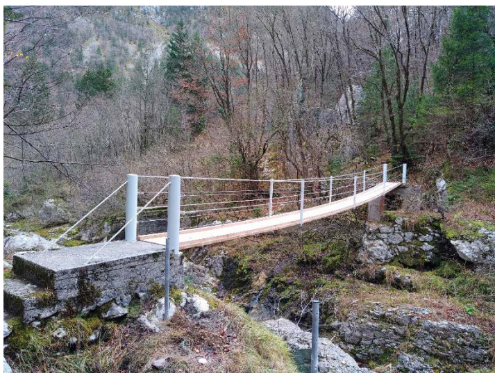
Nova brv pod Klužami; fotografija: Nejc Šerbec

Tik pred trdnjavo Kluže se je uredilo nove kovinske stopnice, ki se zmerno spuščajo proti reki Koritnici. Pohodnike se tako preusmerja z nevarnega in ozkega dela glavne ceste Bovec–trdnjava Kluže. Pod stopnicami je nadelana nova potka, ki pripelje do prvega, novega mostička čez reko, od kjer so uredili tudi 400 metrov dolg podzemni hodnik, ki pelje pod trdnjavo Kluže na drugo stran na razgledno ploščad, kar je dodana vrednost turističnemu obisku. V naslednjih dveh letih bodo pri trdnjavi Kluže uredili še parkirišče in prometni režim. Nova pot s podzemnim hodnikom bo uradno odprta letošnjo pomlad.