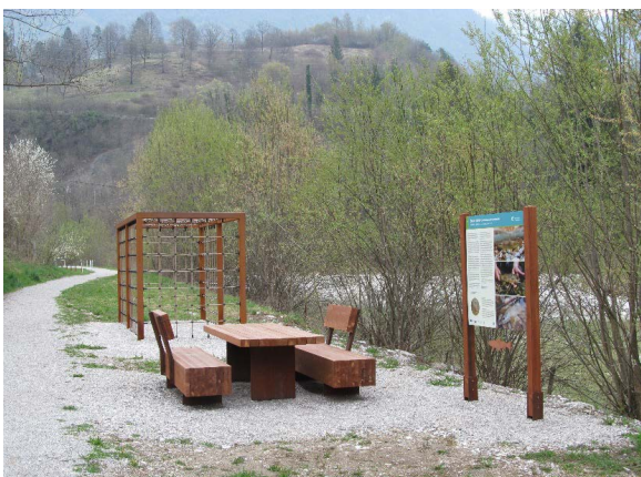
Učna pešpot ob Tolminki

Prizadevamo si za usmerjanje obiskovalcev na manj obremenjena in ustrezno urejena območja. V ta namen je Občina Tolmin uredila in opremila učno pešpot ob Tolminki z ribiškimi učnimi vsebinami in z opremo za kakovostno preživljanje prostega časa na prostem. Pot, ki je namenjena prebivalcem in obiskovalcem, nudi edinstveno učilnico na prostem, posvečeno v prvi vrsti predstavitvi in ozaveščanju pomena soške postrvi ter tradiciji ribištva in ribogojstva na Tolminskem, je pa tudi produkt, ki služi kot urejeno območje za rekreacijo ter za ohranjanje in vzpostavljanje socialnih stikov.