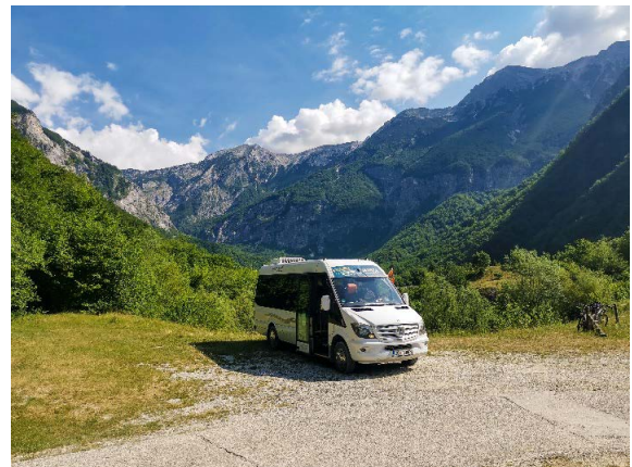
Hop On - hop Off v Javorci

Vozni red je redno objavljen na naši spletni strani, na avtobusnih postajališčih in v zloženki Prevozi v Dolini Soče.