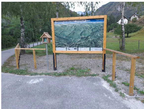
Pot Na svoji zemlji; fotografija: Društvo BDB

Tematska pot Na svoji zemlji je leta 2012 povezala sedem filmskih snemalnih lokacij na Grahovem ob Bači in Koritnici v Baški grapi, s čimer je KTT društvo Baška dediščina poskrbelo za ohranitev dediščine. V zadnjem letu je društvo v sodelovanju z Občino Tolmin nadgradilo tematsko pot z izdelavo novih smerokazov, informacijskih tabel, promocijskih materialov, nabavili so tudi tehnično podporo za interpretacijo in poskrbeli za promocijo tematske poti.