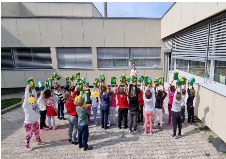
Osnovna šola, Tolmin

V vseh treh občinah se je v letu 2022 skupno postavilo devet zabojnikov za odpadno olje. V preteklem šolskem letu je v aprilu na OŠ Kamno, Volče in Tolmin potekala zbiralna akcija odpadnega jedilnega olja. V ta namen so bili pred šolskimi centri postavljeni zabojniki za odpadno olje, s katerimi so vzpodbujali otroke in posledično starše k pravilnem zbiranju odpadkov.