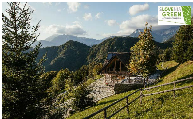
Chalet Astra Montana

V Dolini Soče je zaradi svojih trajnostno začrtanih smernic v svojem razvoju prejelo znak Slovenia Green Accommodation devet ponudnikov turističnih nastanitev: Chalet Astra Montana, Hotel Alp, Nebesa Chalets, Nature View House, Domačija Škvor, Kamp Korita, Kamp Koren Kobarid, Eco Penzion Kobala in Hotel Dvorec.