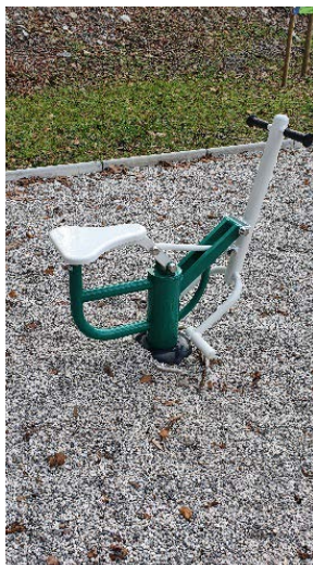
kovinska naprava za razgibavanje