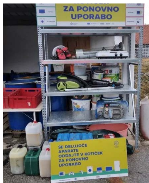
Zbirni center, Volče

Leta 2022 je Komunala Tolmin v sodelovanju s podjetjem ZEOS postavila dva kotička za ponovno uporabo, kamor lahko prebivalci oddajo še delujoče elektronske aparate, ki jih nato podjetje prevzame, pregleda, popravi in vrne v prodajo za ponovno uporabo. Kotička sta postavljena v ZC Volče in v ZC Bovec.