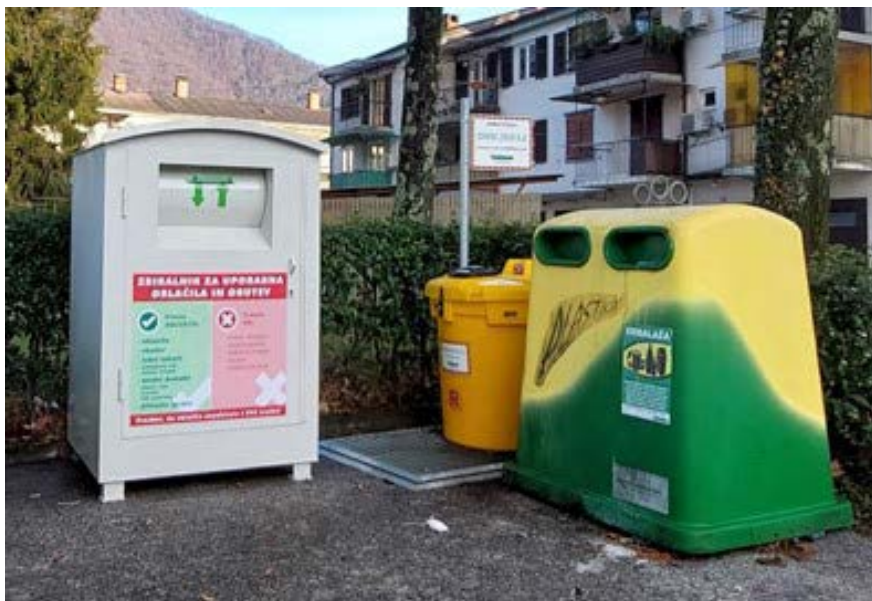
Ekološki otok, Tolmin

Komunala Tolmin je v letu 2021 v Tolminu, Kobaridu in Bovcu uredila prevzemna mesta tekstilnih odpadkov, kar sodi še v en korak k trajnostnemu razvoju. Države članice morajo ločeno zbiranje vzpostaviti do leta 2025, saj je to nujen pristop, ki bo spodbudil inovacije na področju reciklaže.