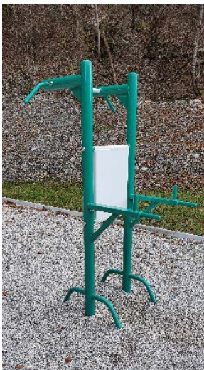
kovinska naprava za razgibavanje